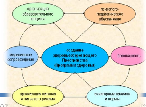
Модель здоровьесберегающего пространства МБОУ «СШ №10»

С 1 по 11 классы согласно учебному плану проводились 3 урока физической культуры в неделю.